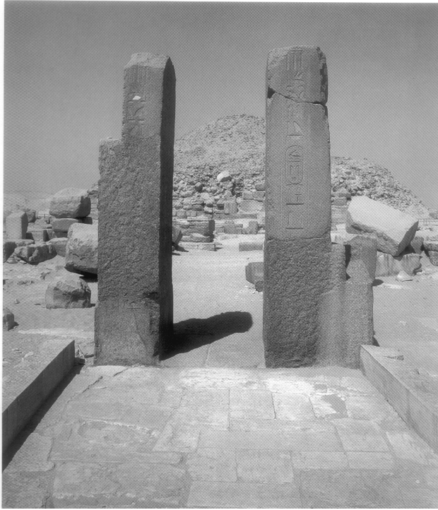
(شكل ٧٤) أطلال الطريق الصاعد الخاص بهرم "أوناس"

نظرا لعدم استكمال أعمال الحفائر في معبد الوادي الملحق بهرم "أوناس"، فلا تتوافر معلومات كافية عنه في الوقت الحالي. أما الطريق الصاعد، فيزيد طوله علي ٦٦٠ مترا، ويبدأ من الجانب الجنوبي الغربي من معبد الوادي. رصفت أرضية المعبد بكتل من الحجر الجيري الجيد، وأحيط من جانبيه بجدارين حجريين، وكان مسقوفا. زين السقف بنجوم ملونة باللون الأصفر على أرضية زرقاء، وزينت جدرانه بمناظر بارزة قليلة الارتفاع، وصورت المناظر حملة القرايين، والصيد، وأسطول من السفن تحضر بعض العناصر المعمارية من أسوان إلى سقارة، ومنها بعض الأعمدة ذات التيجان النخيلية.